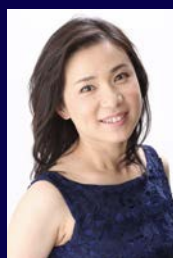
石橋栄実 （ソプラノ）