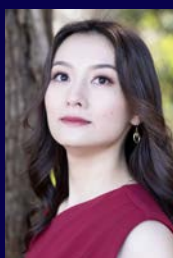
山際きみ佳 （メゾ・ソプラノ）