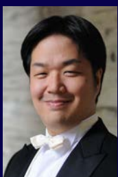
清水徹太郎 （テノール）