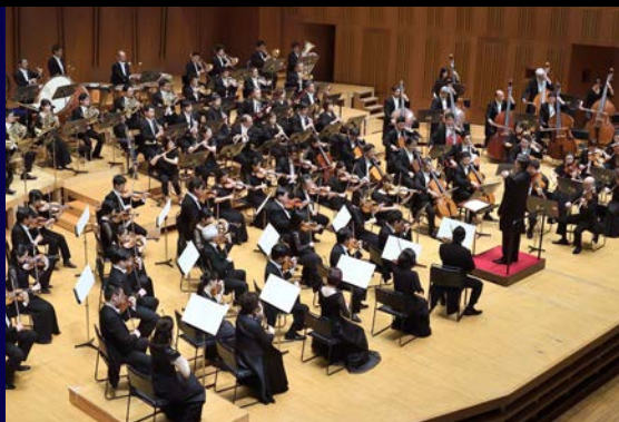
読売日本交響楽団